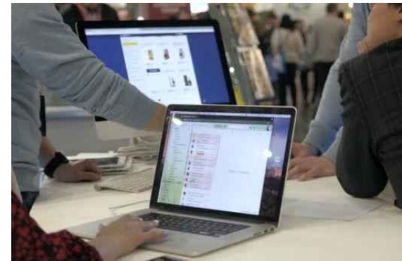
복합기 구비 부스 운영