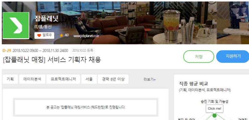
잡플래닛 내 지원하기 버튼 클릭

잡플래닛 내 기업의 채용공고 기반 지원자 사전 모집, 입사 지원 시 잡플래닛 이력서 외 별도 양식으로 사전 지원 가능